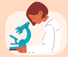
Médecin, pharmacien, IDE Laboratoire de biologie médicale