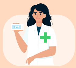
Pharmaciens Officine et Pharmacie à Usage Intérieur