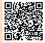
Tableau extension compétences vaccinales : https://sante.gouv.fr/IMG/pdf/tableau_qr_extension_compétences_vaccinales_site_internet_-_vdef_sp1.pdf

Une infection évitée, c'est souvent une antibiothérapie épargnée !